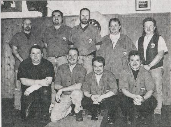
Die beiden Dart-Teams aus Essenbach führen recht unterschiedliche Ergebnisse in der abgelaufenen Saison ein.